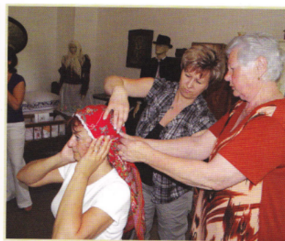
Beseda u stařenky - vázání šátků

Beseda u stařenky - Tvorba filmových materiálů, které zaznamenávají život v obci Věteřov, tak jak si ho pamatují nejstarší obyvatelé obce. Zaměřují se především na tradiční lidské činnosti, které jsou v dnešní době již vzácné (výroba tradičních výrobků - trnková povidla, draní peří, výroba ošatek, pravá vesnická zabijačka, výroba vína atd.).