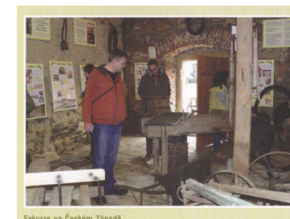
Exkurze na Českém Západě