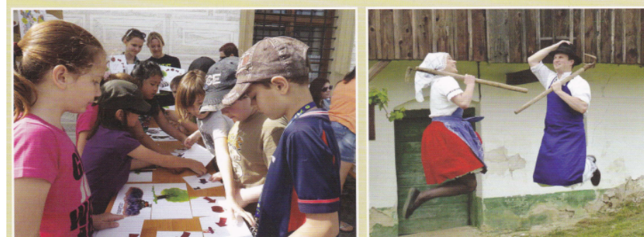
Den Země 2013