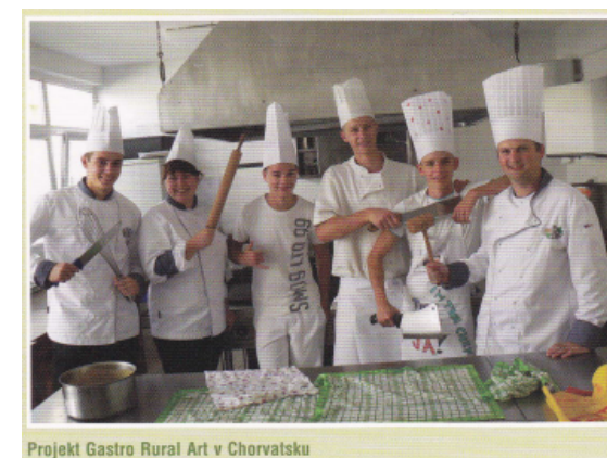
Projekt Gastro Rural Art v Chorvatsku