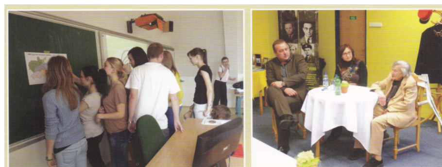
Komunitní plánování v Kivaňově gymnáziu

S koncem letošního roku končí rozpočtové období EU, a také další etapa administrování programu LEADER. Čerpání evropských fondů s sebou přineslo spoustu užitečných projektů, které pomohly rozvoji neziskových organizací, zachránily památky, přičinily se o rozvoj turistiky a podpořily podnikatele. V letošním roce jsme také zahájili práci na nové Strategii. Máme za sebou komunitární plánování v Mikroregionech, školách a zpracovali jsme analytickou část Strategie. Naše MAS se aktivně zapojuje do činnosti NS MAS a spolupracuje s dalšími MAS v oblasti výměny zkušeností, a realizací společných projektů. Stále se držíme v žebříčku hodnocení MAS na nejvyšších příčkách.