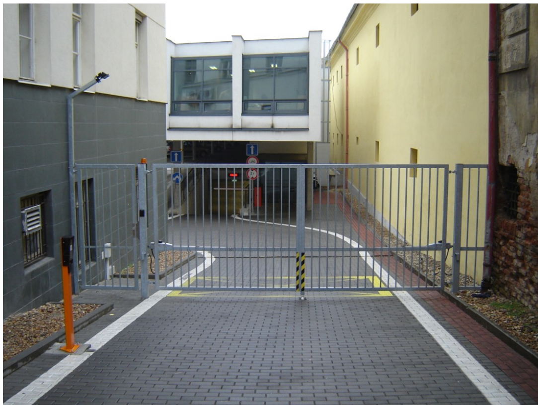
Vjezd do garáží

Při odjezdu využijte výhradně výjezd směr Bratislavská ulice - závora i brána se otevírá samočinně.