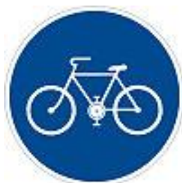
C8a Stezka pro cyklisty

A) Rekonstrukce, modernizace a výstavba samostatných stezek pro cyklisty nebo stezek pro cyklisty a chodce se společným nebo odděleným provozem s dopravním značením C8a,b, C9a,b nebo C10a,b, sloužících k dopravě do zaměstnání, škol a za službami