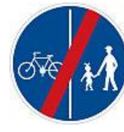
C10b Konec stezka pro chodce a cyklisty - dělená