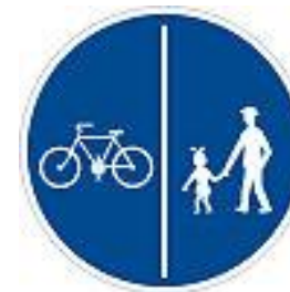
C10a Stezka pro chodce a cyklisty - dělená