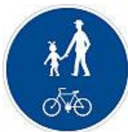
C9a Stezka pro chodce a cyklisty - společná