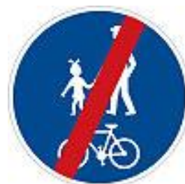
C9b Konec stezka pro chodce a cyklisty - společná