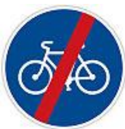
C8b Konec stezky pro cyklisty