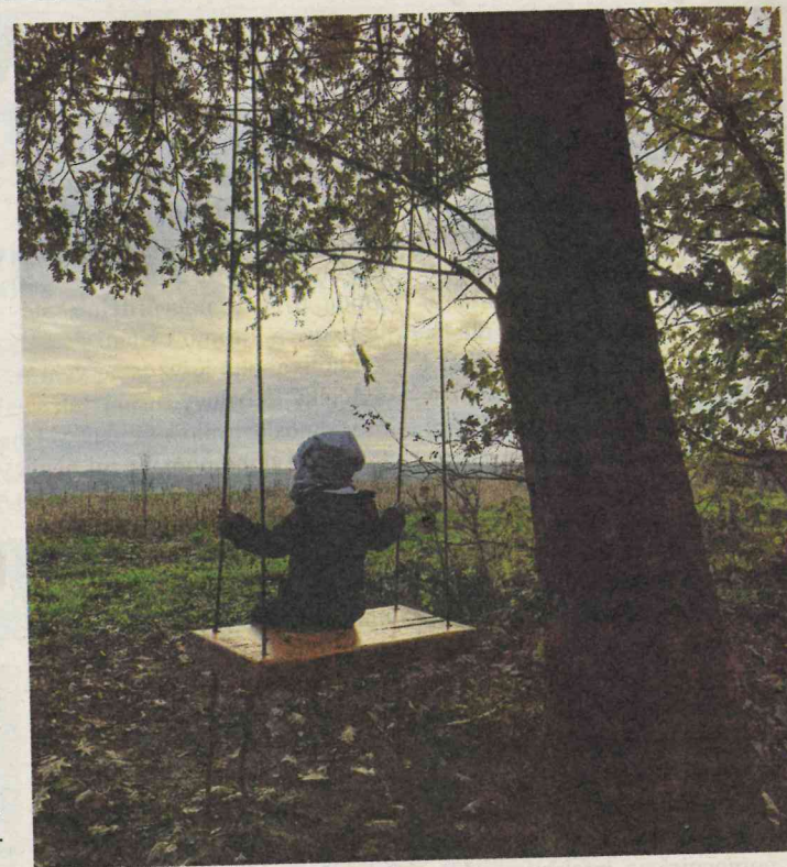
Houpačky v krajině Kyjovska jsou lákavým cílem.