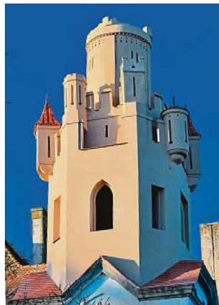
Na zámku aktuálně končí oprava jižní věže.

„Co se týče budoucnosti, na tom spolupracuji s architektem Liborem Foukalem, který vytvořil nejen studii, ale i pro-