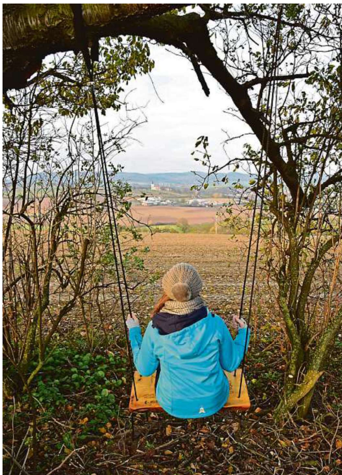
Zhoupnout se při pohledu do krajiny mohou výletníci na čtrnácti místech na Kyjovsku. U některých přibylly i úkoly pro děti.

„Aktuálně nám visí třináct houpaček, jedna je v rekonstrukci. Materiál má jenom omezenou životnost, je potřeba obměňovat lana. Postupně obnovíme všechny houpačky. V krajině zůstávají