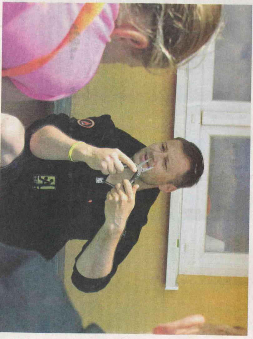
Některé nože vám zajistí v přírodě mnohem víc, než jen řezání.