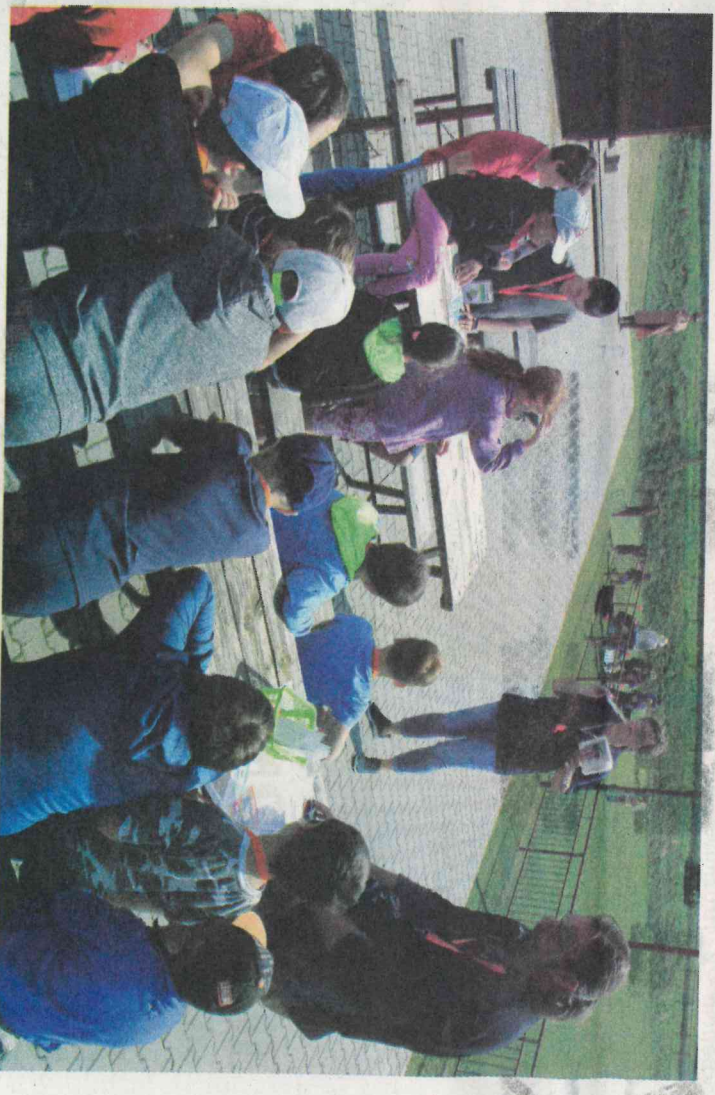
Evakuace dětí tak zaujala, že ani nevytrřišovnyh.