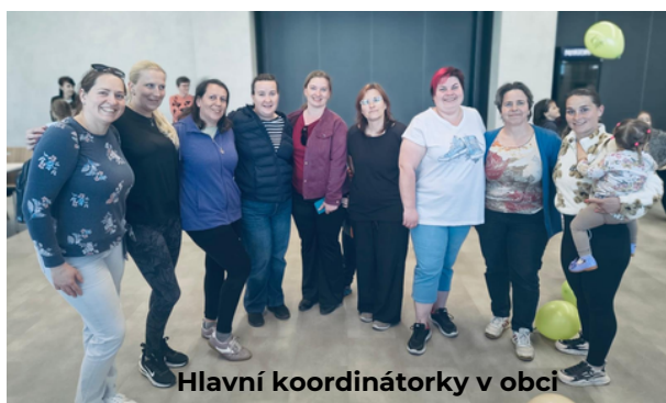
Hlavní koordinátorky v obci