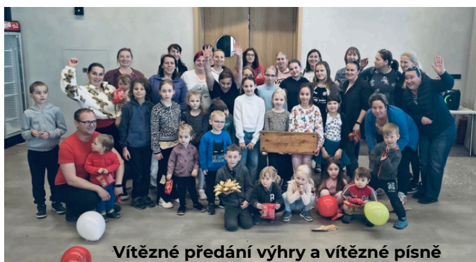
Vítězné předání výhry a vítězné písně