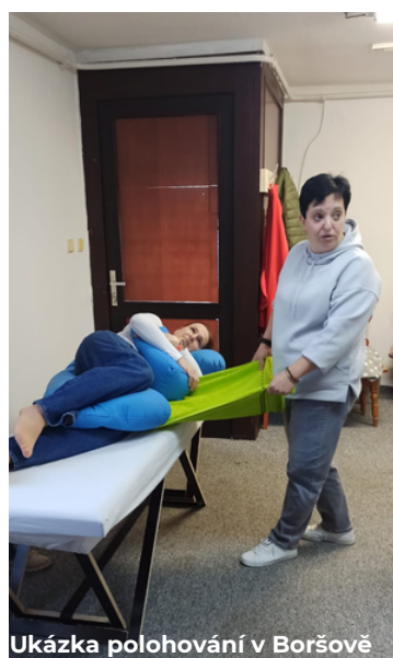
Ukázka polohování v Boršově